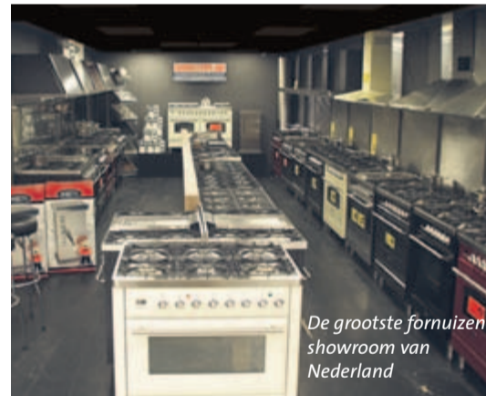
De grootste fornuizen showroom van Nederland

de apparatuur via de webshop bestellen. Ook al onze keukens zijn op de website te zien, maar niet te bestellen. Een keuken schaft u niet aan zonder een vakkundig advies', aldus Jan Boon. Tevens is het nu ook mogelijk om zelf je keukens te ontwerpen via de vernieuwde website.