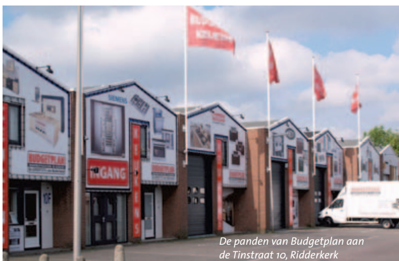
De panden van Budgetplan aan de Tinstraat 10, Ridderkerk