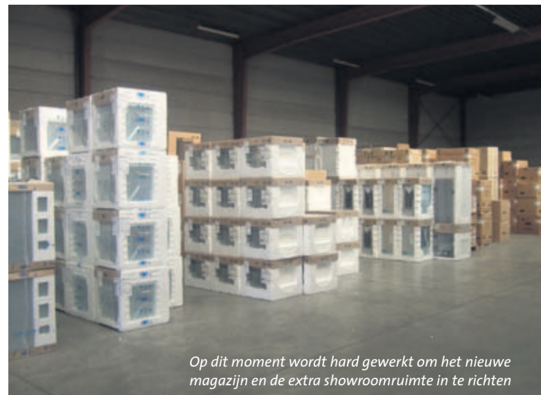
Op dit moment wordt hard gewerkt om het nieuwe magazijn en de extra showroomruimte in te richten