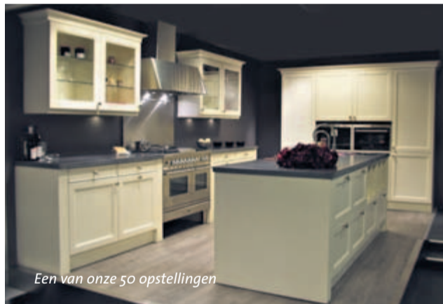
Een van onze 50 opstellingen

Eigen webshop Er is nog meer nieuws te melden. Budgetplan opent begin 2011 een webshop. Meer dan duizend artikelen uit het assortiment zijn straks via internet te koop. 'Wie in de winkel advies heeft ingewonnen en nog even over de aanschaf wil nadenken, kan na de beslissing